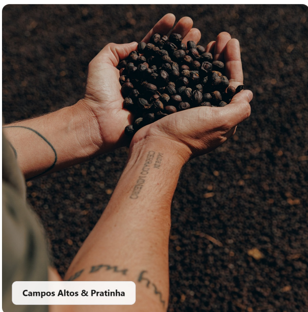
Campos Altos & Pratinha